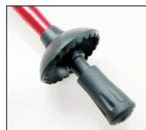
Teller + Spitze abnehmbar = sicherer Gang in jedem Gelände