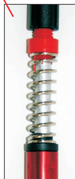
Anti- Schock- Federung