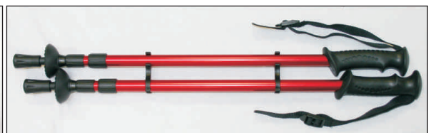
geringes Packmaß (60 x 9 cm) = platzsparendes Verstauen